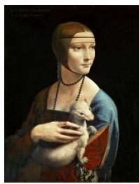
Возрождени я (Ренессанс)