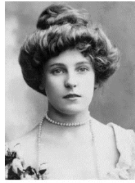
Декаданс (конец 19 в),