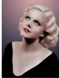
30- 50-е годы