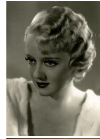
Начало 20 в.