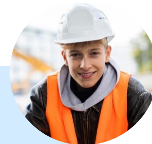
Фото (на однотонном светлом фоне, фото должно быть четкое, не искажающее внешность изображенного на нем человека, размер от 1000px по меньшей стороне в формате JPEG. Можно сделать подборку интересных фото).

История успеха выпускника – это эмоциональный рассказ о достижениях выпускника после окончания образовательной организации, о роли образовательной организации в его жизни.