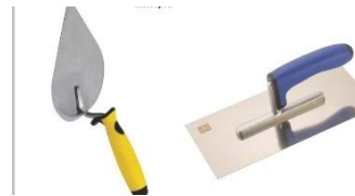
Мастерок и кельма