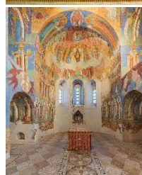
Средние века (Русь)