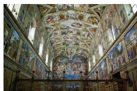
Раннее Возрождение (Европа)