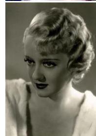
Начало 20 в.