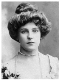
Декаданс (конец 19 в),