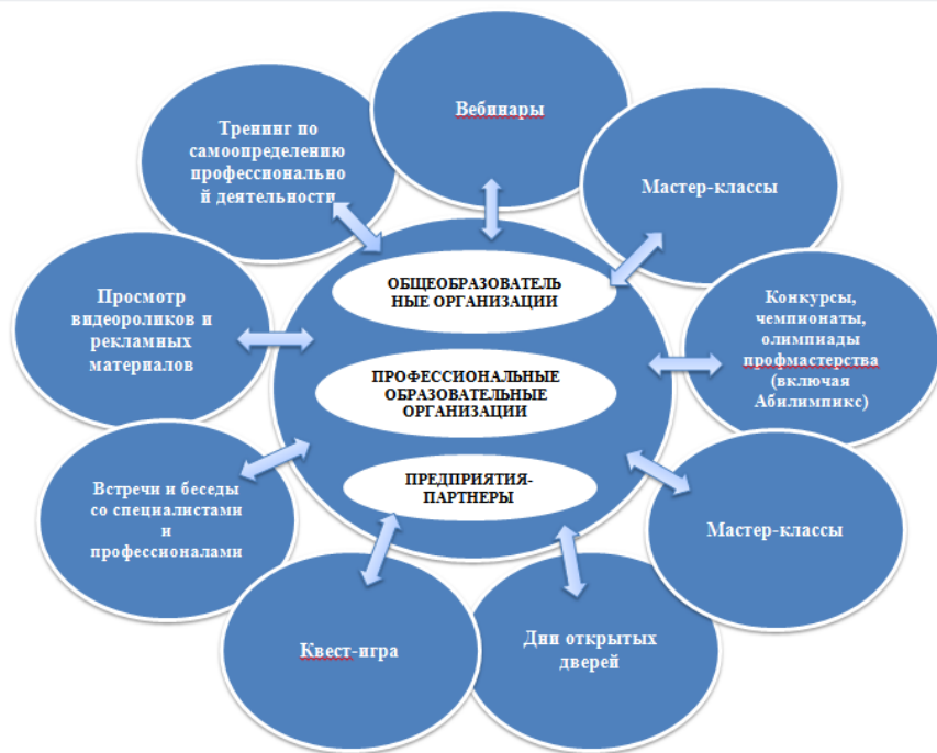
Рис. 2. Основные мероприятия профориентации обучающихся с ограниченными возможностями здоровья и инвалидностью.

можно представить мероприятия по профориентации лиц с инвалидностью и ОВЗ в следующем виде (см. Рис 2.):